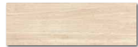
WADVE030 82 / m 2 lesk | glossy