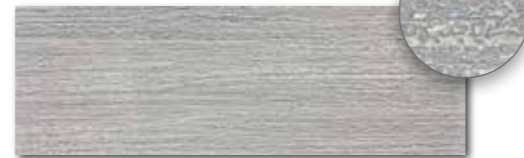
WITVE128 74 / ks mat | matt