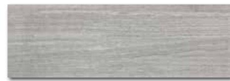
WADVE028 82 / m 2 lesk | glossy