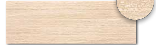
WITVE130 74 / ks mat | matt