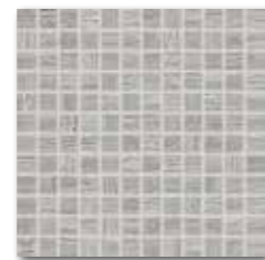
WDM02228 (SET) 78 / set mat/lesk | matt/glossy