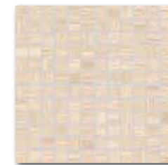
WDM02230 (SET) 78 / set mat/lesk | matt/glossy

béžová / beige / bežowa / бежевый / bézs / beige