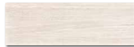
WADVE029 82 / m 2 lesk | glossy

světle béžová / light beige / jasnobežowa светло-бежевый / világosbézs / beige claro