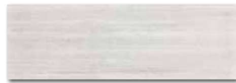
WADVE027 82 / m 2 lesk | glossy

světle šedá / light grey / jasnoszara светло-серый / világosszürke / gris claro