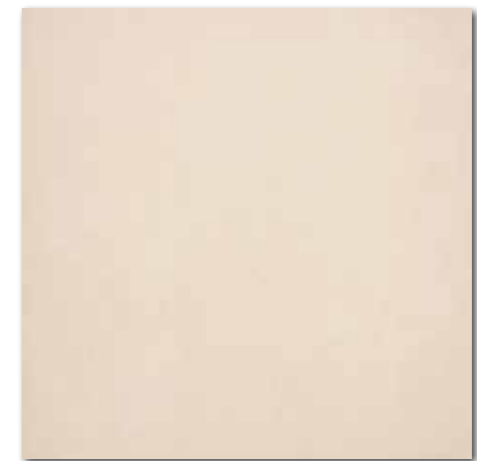
DAK63658 Trend PEI 5 82 / m 2 mat | matt

šedá / grey / szara / серый / szürke / gris