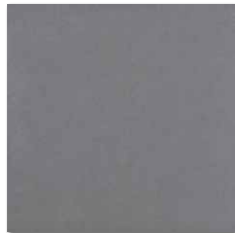
DAK63655 Trend PEI 4 82 / m 2 mat | matt

tmavě šedá / dark grey / ciemnoszara темно-серый / sötétszürke / gris oscuro