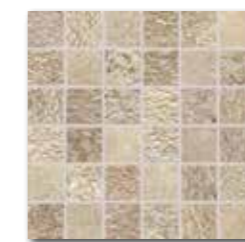
DDM05693 (SET) PEI 5 ○ 72 / set mat | matt