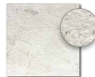
DAR3B692 PEI 5 ○ 74 / m 2 mat | matt