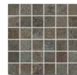
DDM05694 (SET) PEI 3 ○ 72 / set mat | matt