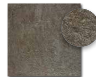
DAR3B694 PEI 3 ○ 74 / m 2 mat | matt