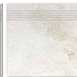
DCP3B692 PEI 5 ○ 44 / ks mat | matt