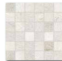
DDM05692 (SET) PEI 5 ○ 72 / set mat | matt