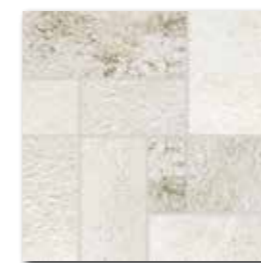
DDP3B692 (SET) PEI 5 ○ 72 / set mat | matt