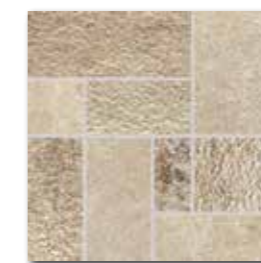
DDP3B693 (SET) PEI 5 ○ 72 / set mat | matt