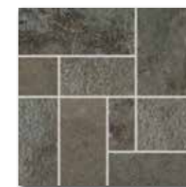
DDP3B694 (SET) PEI 3 ○ 72 / set mat | matt