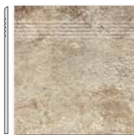
DCP3B693 PEI 5 ○ 44 / ks mat | matt