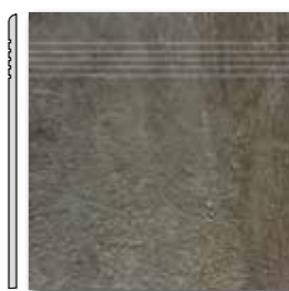
DCP3B694 PEI 3 ○ 44 / ks mat | matt