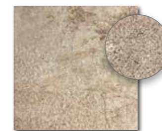
DAR3B693 PEI 5 ○ 74 / m 2 mat | matt