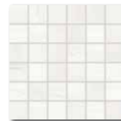
WDM06525 (SET) 66 / set mat | matt