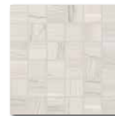
WDM06526 (SET) 66 / set mat | matt

bílá / white / biata / белый / fehér / blanco