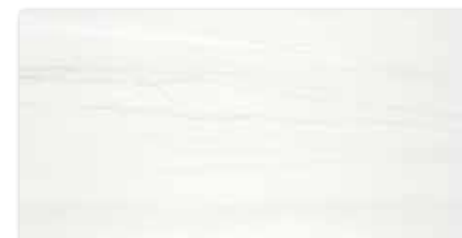
WAKV4525 84 / m 2 mat | matt

bílá / white / biata / белый / fehér / blanco