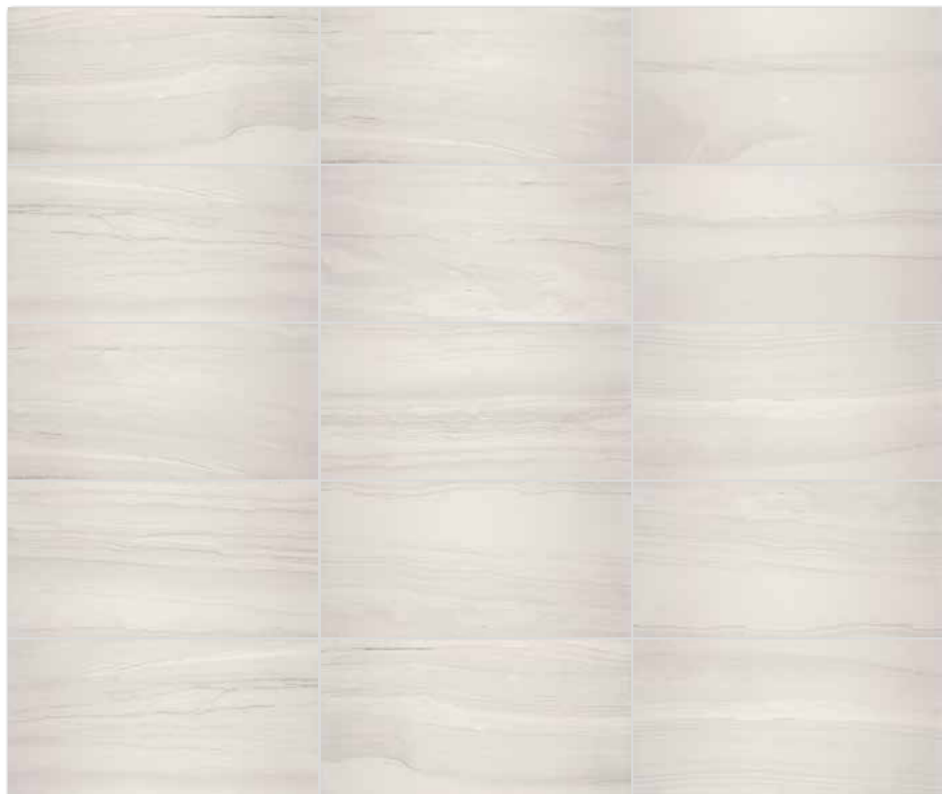
Všechny výrobky celé série vykazují velké odchylky odstínové difference V3. / All products of the entire batch show big deviations in shade difference V3.

Před pokládkou doporučujeme jednotlivé obkládací prvky vybrat z několika kartonů a výslednou plochu komponovat podle inspirativní fotodokumentace z katalogů RAKO případně z webových stránek www.rako.cz