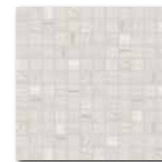
WDM02526 (SET) 78 / set mat | matt