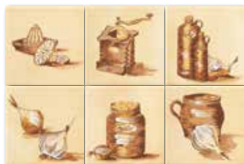
WIT1B043 ○ 78 / set mat | matt