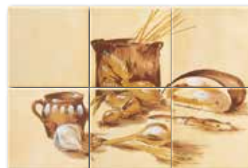
WITP4042 ○ 76 / set mat | matt