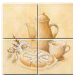
WIT32258 ○ 52 / set mat | matt