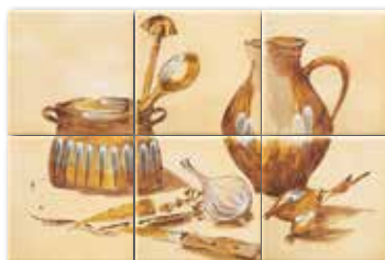
WITP4035 ○ 76 / set mat | matt