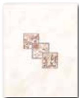
WITGX113 ○ 32 / ks lesk | glossy