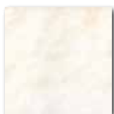
GAT24739 PEI 4 ○ 64 / m 2 mat | matt

běžová / beige / бежова бежевый / bézs / beige