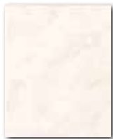
WAAGX103 ○ 56 / m 2 lesk | glossy