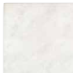
GAT2J740 PEI 4 ○ 64 / m 2 mat | matt

šedá / grey / szara серый / szürke / gris