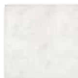
GAT24740 PEI 4 ○ 64 / m 2 mat | matt

šedá / grey / szara серый / szürke / gris