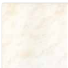
GAT2J739 PEI 4 ○ 64 / m 2 mat | matt

běžová / beige / бежова бежевый / bézs / beige