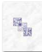
WITGX110 ○ 32 / ks lesk | glossy