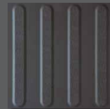
30x30 TTF35019 R11 \mu \geq 0,6