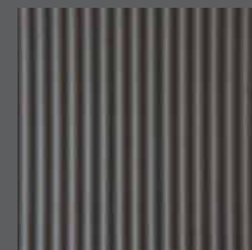
30x30 GTF35019 R11 \mu \geq 0,6