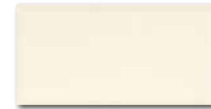
WADMB124 82 / m 2 lesk | glossy