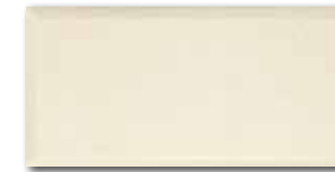
WADMB224 82 / m 2 lesk | glossy