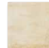
DAR2W663 Siena PEI 5 82 / m 2 mat | matt