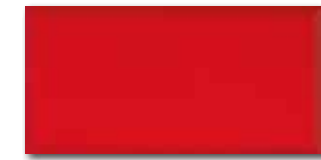
WADMB125 82 / m 2 lesk | glossy