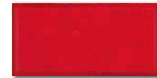
WADMB225 82 / m 2 lesk | glossy