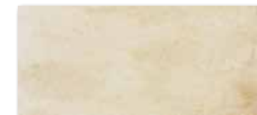
DARPP663 Siena PEI 5 82 / m 2 mat | matt

světle béžová / light beige / jasnobežowa / светло-бежевый világosbézs / beige claro