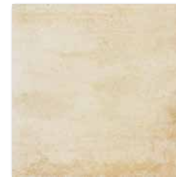
DAR44663 Siena PEI 5 78 / m 2 mat | matt

světle béžová / light beige / jasnobežowa / светло-бежевый világosbézs / beige claro