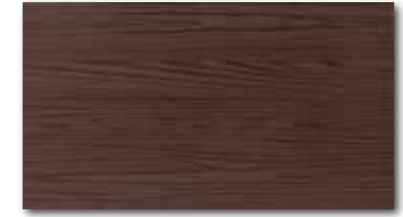
WATP3025 ○ 76 / m 2 mat/lesk | matt/glossy