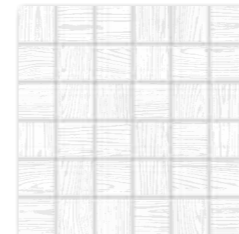
WDM05024 (SET) ○ 66 / set mat/lesk | matt/glossy