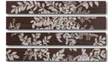
WLAPP001 (SET) ○ 84 / set mat/lesk | matt/glossy hnědá / brown / brązowa / коричневый / barna / marrón