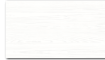
WATP3024 ○ 76 / m 2 mat/lesk | matt/glossy