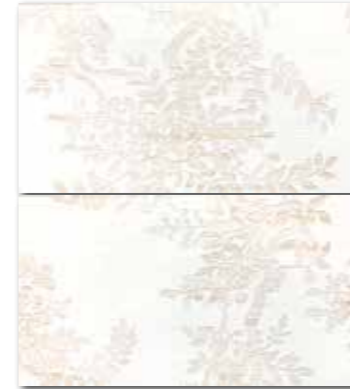
WITP3019 (SET) ○ 82 / set mat/lesk | matt/glossy bílá / white / biata / белый / fehér / blanco