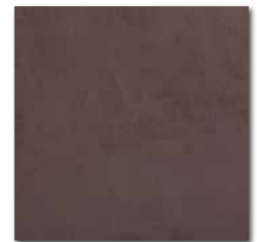
DAK44274 Sandstone Plus PEI 5 ○ 78 / m 2 mat | matt hnědá / brown / brązowa / коричневый / barna / marrón