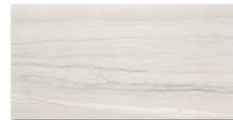
WAKV4526 84 / m 2 mat | matt

bílá / white / biata / белый / fehér / blanco