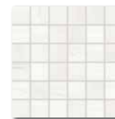
WDM06525 (SET) 66 / set mat | matt