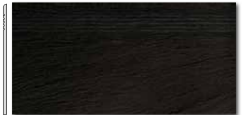
DCPSE314 PEI 5 ○ 72 / ks mat | matt | R10 | A