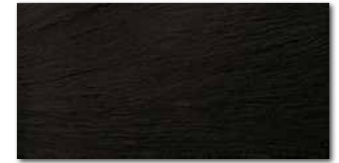
DARSE314 PEI 5 ○ 80 / m 2 mat | matt