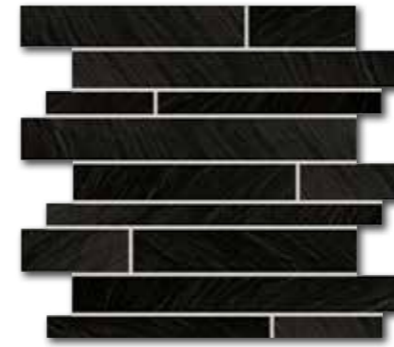
DDP44314 (SET) PEI 5 ○ 72 / set mat | matt | R10 | B | A