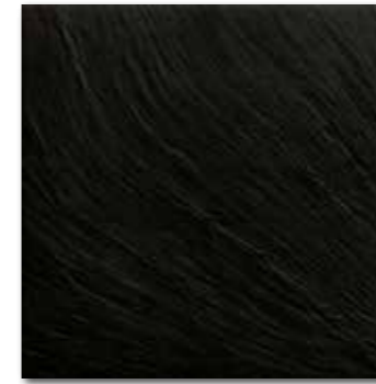
DAR44314 PEI 5 ○ 80 / m 2 mat | matt