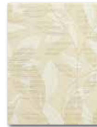
WITKB091 Ø 58 / ks mat | matt