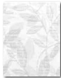
WITKB090 Ø 58 / ks mat | matt