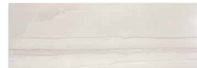
WAKV5526 ○ 90 / m 2 mat | matt

světle šedá / light grey / jasnoszara / светло-серый / gris claro