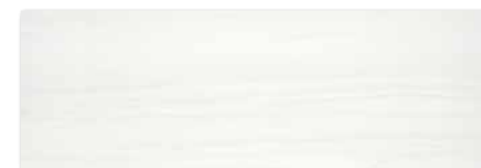
WAKV5525 ○ 90 / m 2 mat | matt