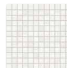
WDM02525 (SET) ○ 78 / set mat | matt