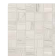
WDM06526 (SET) ○ 66 / set mat | matt