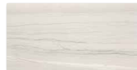
WAKV4526 ○ 84 / m 2 mat | matt

světle šedá / light grey / jasnoszara / светло-серый / gris claro