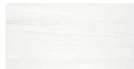
WAKV4525 ○ 84 / m 2 mat | matt