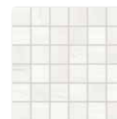
WDM06525 (SET) ○ 66 / set mat | matt