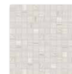
WDM02526 (SET) ○ 78 / set mat | matt