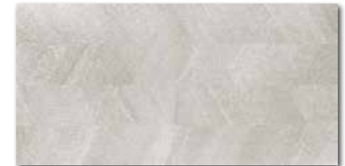
WAKV4533 ○ 82 / m 2 mat | matt