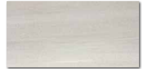
WAKV4531 ○ 80 / m 2 mat | matt