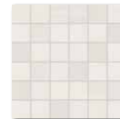
WDM06530 (SET) ○ 66 / set mat | matt