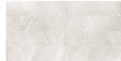
WAKV4532 ○ 82 / m 2 mat | matt