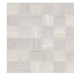
WDM06531 (SET) ○ 66 / set mat | matt