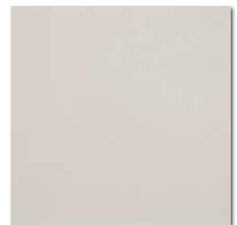
DAK63653 Trend PEI 5 ○ 82 / m 2 mat | matt

slonová kost / ivory / kość stoniowa слоновая кость / marfil