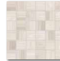
DDM06715 (SET) PEI 5 ○ 72 / set mat | matt