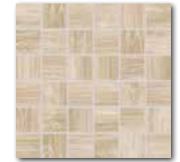
DDM06716 (SET) PEI 4 ○ 72 / set mat | matt