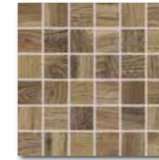
DDM06718 (SET) PEI 4 ○ 72 / set mat | matt