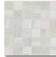
DDM06719 (SET) PEI 5 ○ 72 / set mat | matt