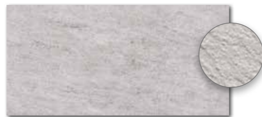
DARSE631 PEI 5 ○ 540 l m 2 matt