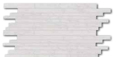
DDPSE630 PEI 5 ○ 580 l set matt hellgrau | light grey | gris clair