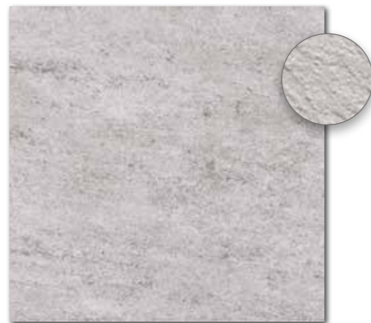
DAR63631 PEI 5 ○ 560 l m 2 matt