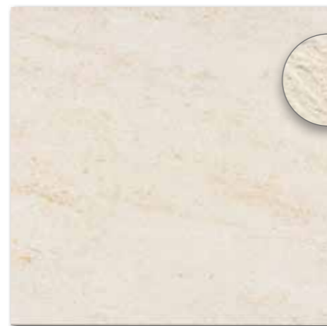
DAR63628 PEI 5 ○ 560 l m 2 matt