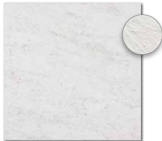
DAR63630 PEI 5 ○ 560 l m 2 matt