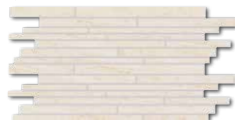
DDPSE628 PEI 5 ○ 580 l set matt hellbeige | light beige | beige clair