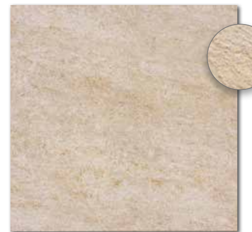
DAR63629 PEI 5 ○ 560 l m 2 matt