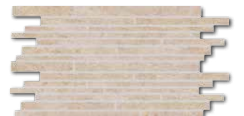
DDPSE629 PEI 5 ○ 580 l set matt beige | beige | beige