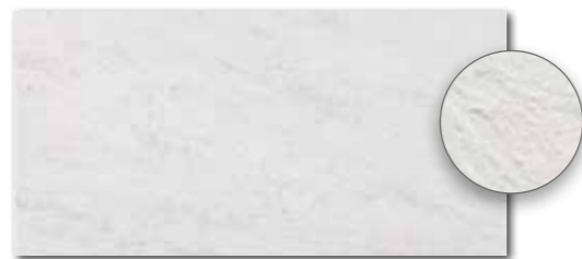
DARSE630 PEI 5 ○ 540 l m 2 matt