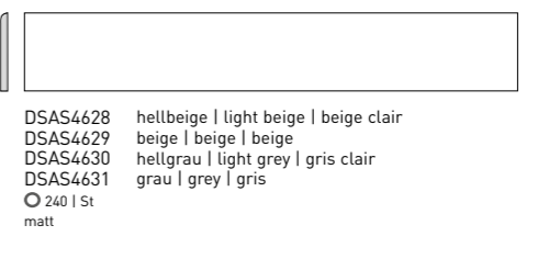
DSAS4631 PEI 5 ○ 240 l St matt grau | grey | gris