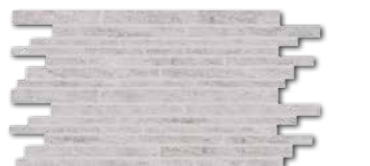
DDPSE631 PEI 5 ○ 580 l set matt grau | grey | gris