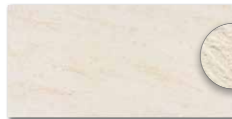
DARSE628 PEI 5 ○ 540 l m 2 matt