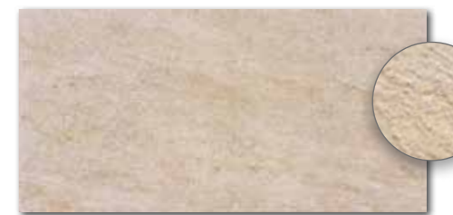
DARSE629 PEI 5 ○ 540 l m 2 matt