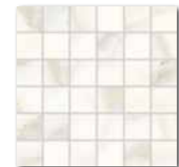
DDM06830 PEI 5 ○ 440 | Netz matt | R10 | B