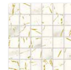
WDM06731* WDM05731** ○ 320 l Netz matt