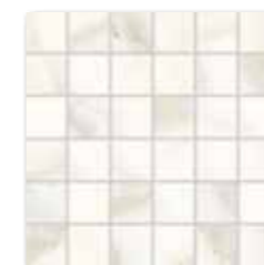
WDM06730* WDM05730** ○ 320 l Netz matt