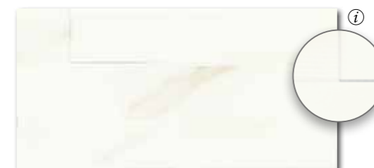
WARV4730* WARVK730** ○ 500 l m 2 matt