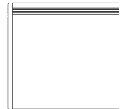
DCP63830 PEI 5 ○ 460 | St matt | R9 | A