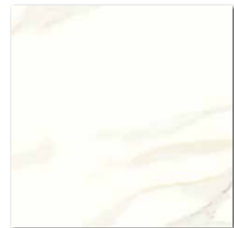
DAK63830 PEI 5 ○ 610 | m 2 matt | R9 | A